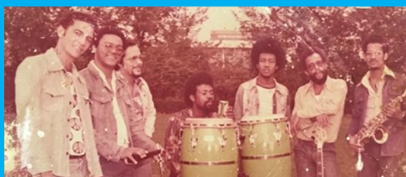
Combo Pa-tin-pret di Tilburg Hulanda